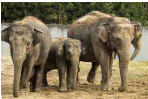
Lukáš Holub, 11 let

S rodinou jsme si to hodně užili. Těším se na další výlet do zoo.