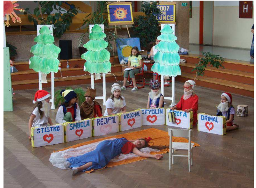
představení Sněhurka a sedm trpaslíků