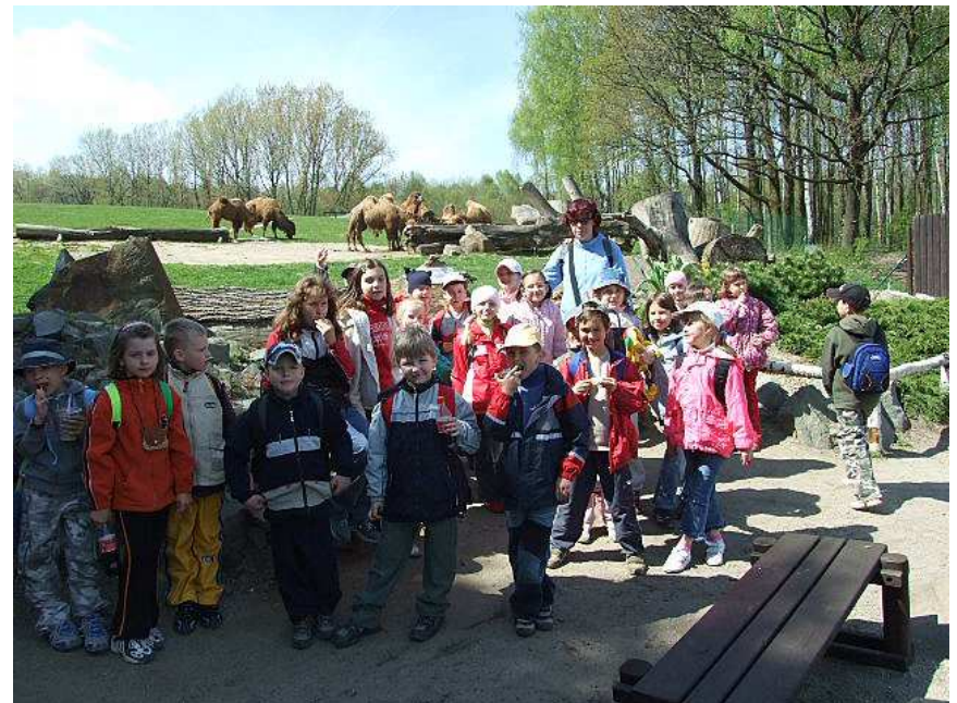
výlet do zoologické zahrady