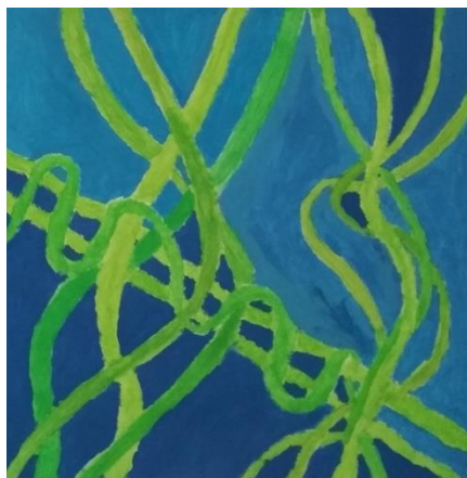
Mgr. Renáta Sýkorová

Věříme, že tato exkurze bude pro žáky velmi zajímavá a odnesou si z ní mnoho nezapomenutelných zážitků. Těšíme se na vás.